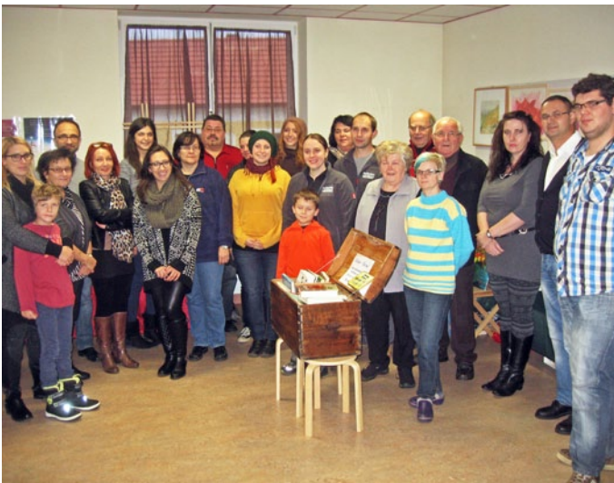
Adventmarkt im Feuerwehrhaus: Kunst - Handwerk - Genuss aus Neuberg