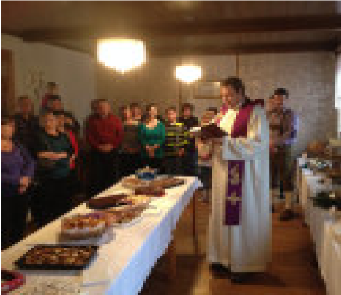
Krippenausstellung am 30. November im Gasthaus Dergovits in Neuberg-Bergen

Mit einer rhythmischen Messe am 29. November 2014 wurde der Advent eingeleitet, viele weitere Veranstaltungen folgten.