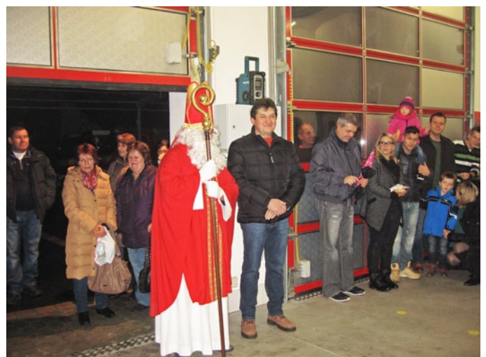
Der Nikolaus kommt ins Feuerwehrhaus