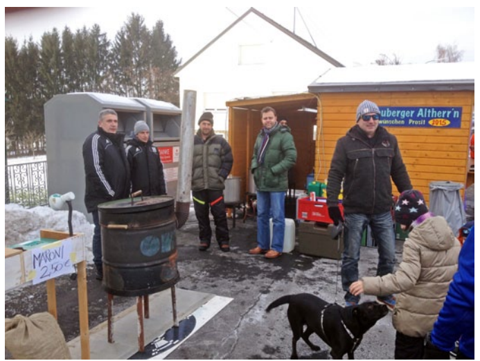
Mit dem Silvesterlauf und der Punschhütte der "Altherren" und einer Silvesterfeier der Feuerwehrjugend fand das Jahr 2014 einen sportlichen und feucht-fröhlichen Ausklang.