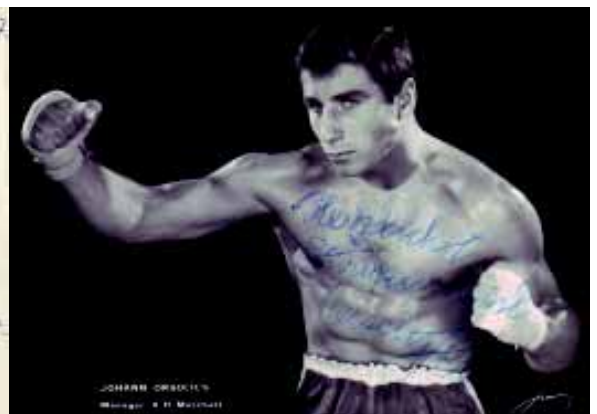
Widmung und Dankschreiben vom 18. Juli 1967 (aus der Gemeindechronik)