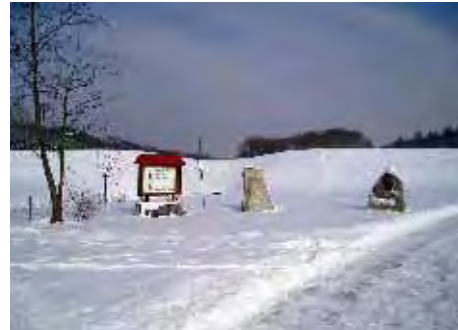
Rückhaltebecken Neuberg-Lukabach 64.769 m 2

Diese abgebildeten Häuser und weitere 7 Häuser konnten auf Kommissierungsbauplätzen bisher errichtet werden. ( insgesamt wurden 100 Bauplätze geschaffen )