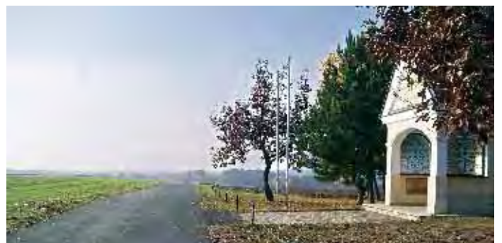
Weg bei Hubertuskapelle