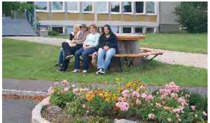
Kaum fertig - schon besetzt

Im Jahre 1994 starb eine der 3 Eichen aus dem 17. Jahrhundert plötzlich ab. Für die Nachwelt wurde ein Großteil des Stammes belassen. Nunmehr wurde der obere Teil des Stammes für die Nachwelt zur Schau gestellt, aus dem unteren Teil ein Tisch mit Sitzgelegenheit errichtet.