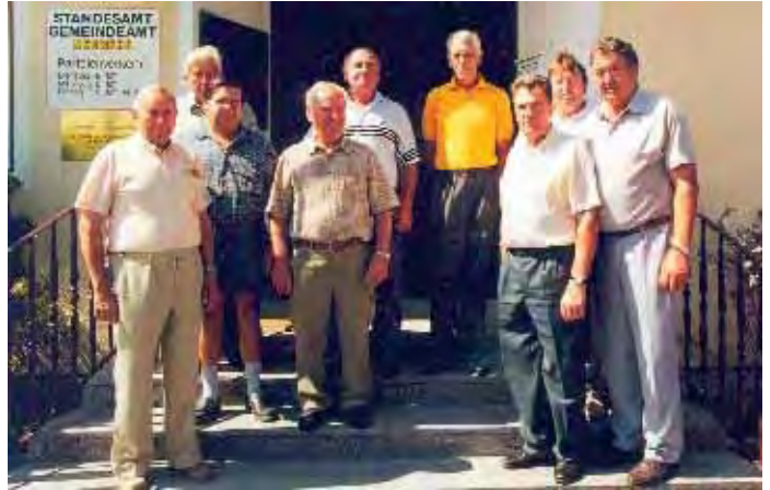
Kommissierungsausschuss nach Abschluß am 10. August 2000