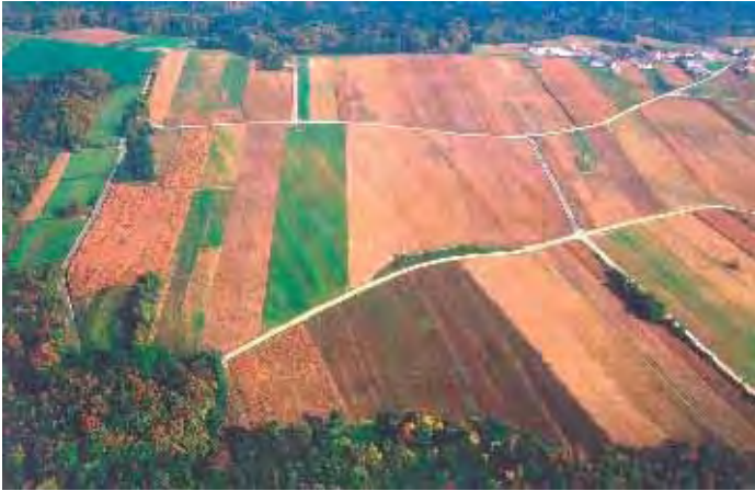
Flugbildaufnahme nach der Kommissierung: man sieht deutlich die alten gebogenen Raine