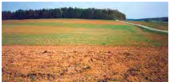
Beseitigung von Nassflächen durch Änderung der Abfindungsrichtung