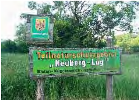
Teilnaturschutzgebiet 51.068 m 2