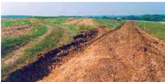
Vor der Kommissierung (im Ausbau)

Gerade - gut ausgebaute Wege sind in der Kommissierung selbstverständlich