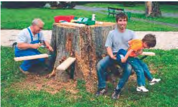
Errichtung Sitzgelegenheit mit Tisch

Im Jahre 1994 starb eine der 3 Eichen aus dem 17. Jahrhundert plötzlich ab. Für die Nachwelt wurde ein Großteil des Stammes belassen. Nunmehr wurde der obere Teil des Stammes für die Nachwelt zur Schau gestellt, aus dem unteren Teil ein Tisch mit Sitzgelegenheit errichtet.