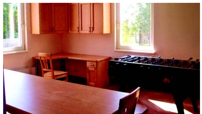
Planmäßig erfolgte Bau des Feuerwehrhauses