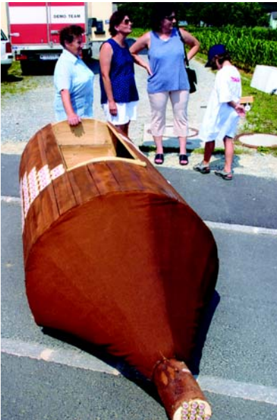
1. Preis "Flaschenzug"