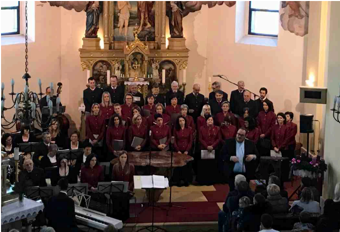
Adventkonzert des Gesangsvereins