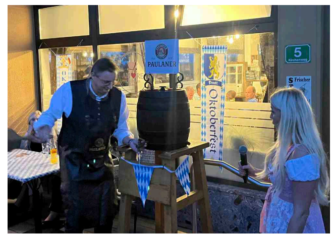
Oktoberfest im Café Amore