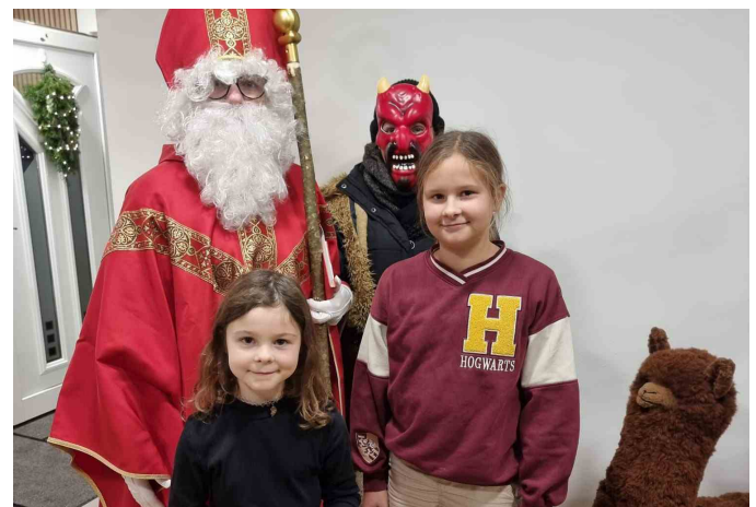
Nikolausbesuche der Familien-Union-Neuberg