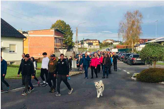
Fitmarsch des SV Neuberg