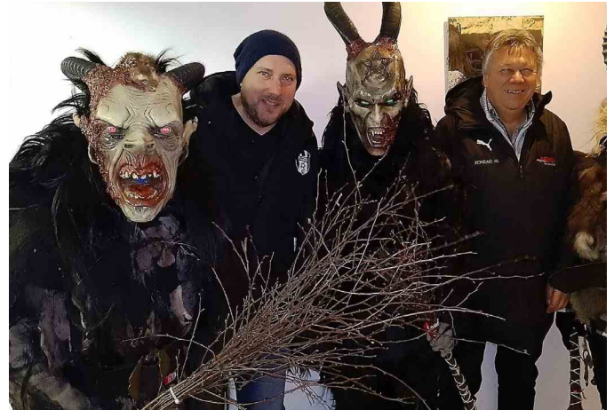
Krampuslauf & Punschstand des SV Neuberg