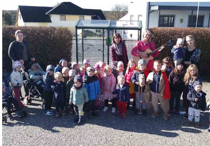
Laternenfest im Kindergarten