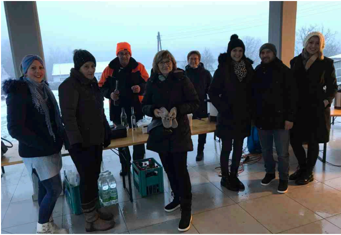
Adventeröffnung mit rhythmischer Messe