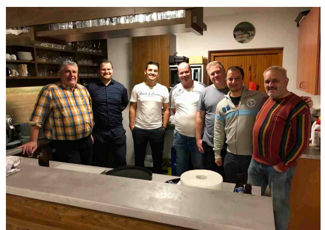
Schnapsen TC Neuberg-Bergen