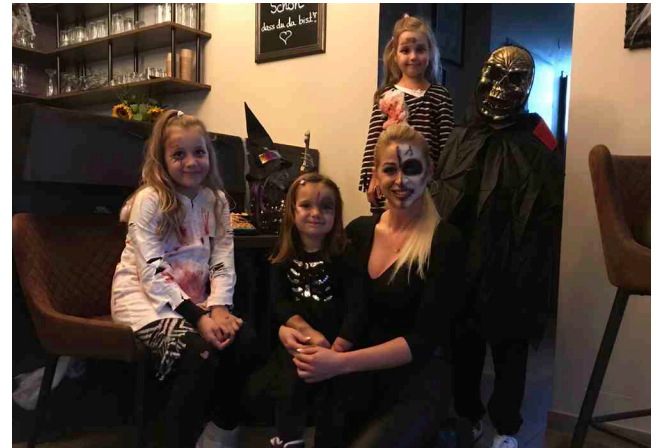
Halloween im Café Amore