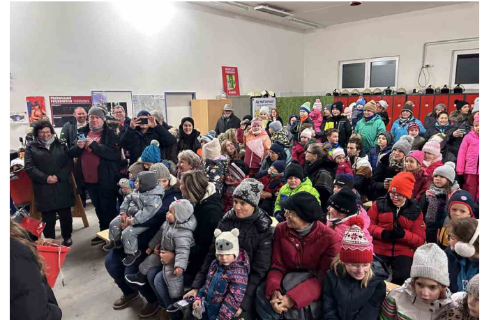
Nikolaus im Feuerwehrhaus