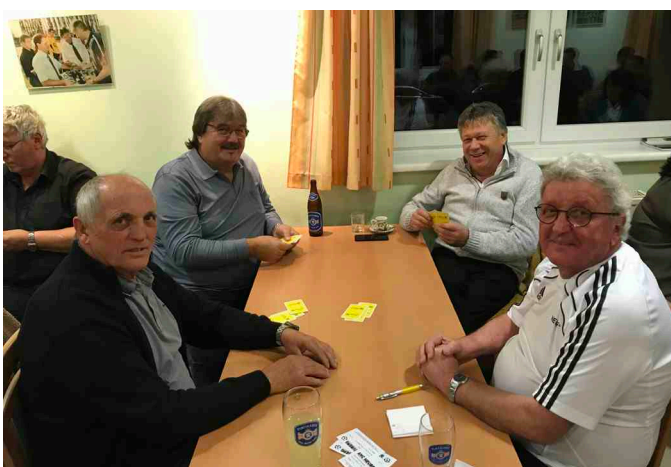
Schnapsen AHC Neuberg