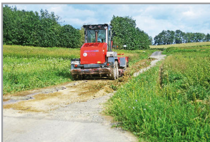
Graderarbeiten Oberes Biotop