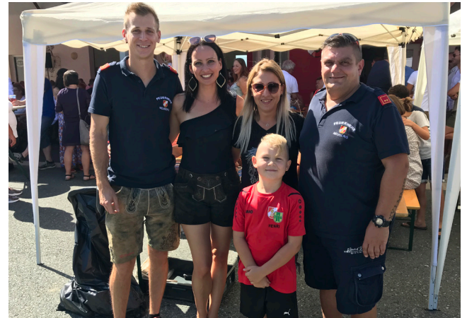
Frühschoppen der Freiwilligen Feuerwehr