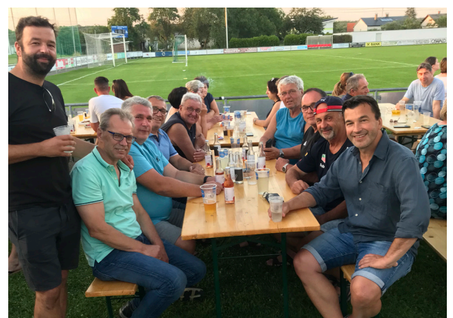
Kleinfeldturnier des AHC