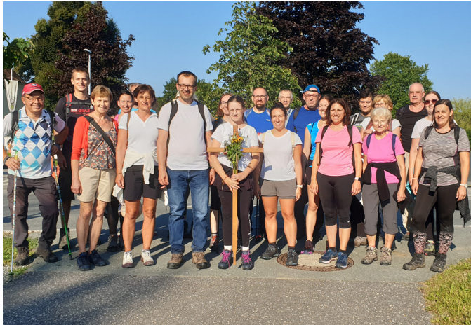
Fußwallfahrt nach Ollersdorf