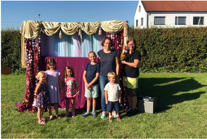
EKIZ-Flohmarkt mit Kasperltheater