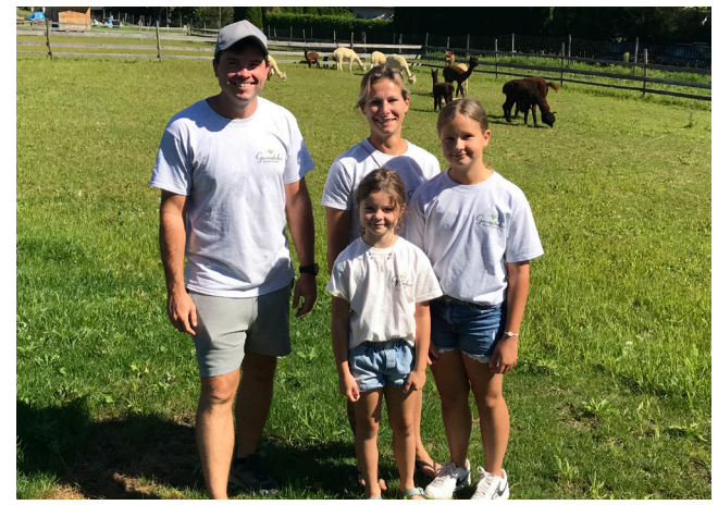
Hoffest Uhudlerland-Alpakas und Eröffnung Hofladen