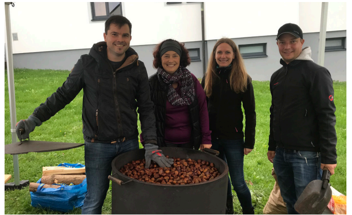
Sturm und Maroni der Familienunion Neuberg