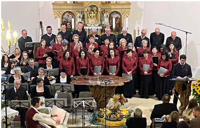
Herbstkonzert des Gesangsvereins und der Tamburizza