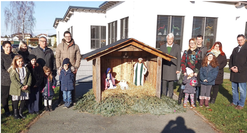
Segnung der Krippe