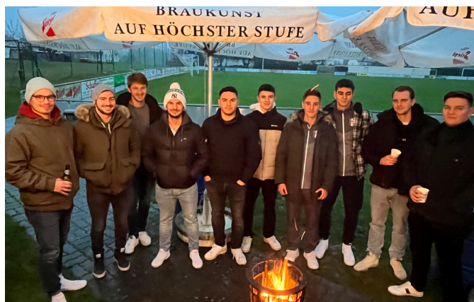
Punschstand des SV Marsch Neuberg