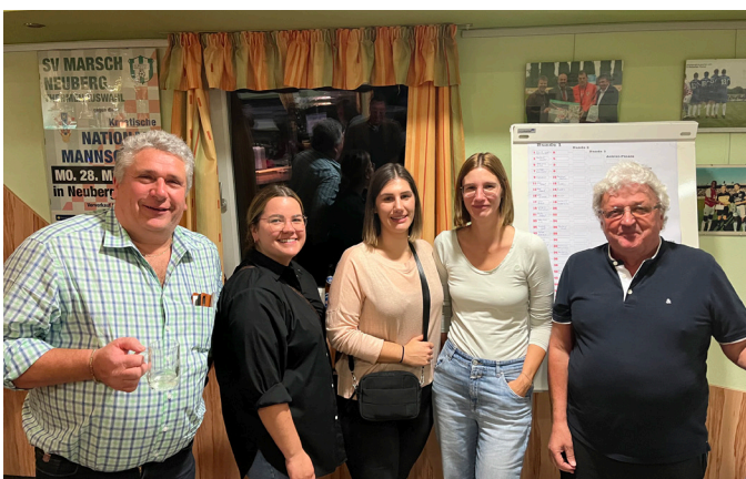
Schnapsen des AHC Neuberg