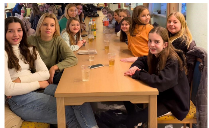
Weihnachtsfeier der Fußballmädchen