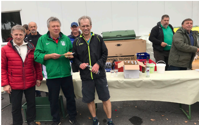
Fitmarsch SV Marsch Neuberg