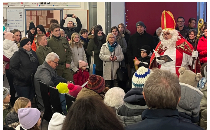
Adventmarkt und Nikolaus-Besuch