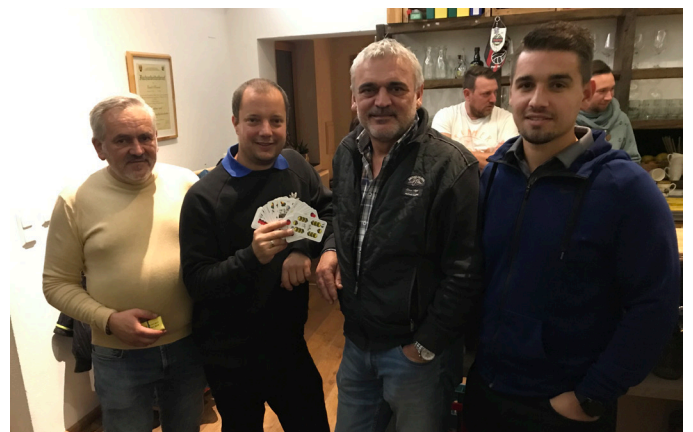
Schnapsen des TC Neuberg Bergen