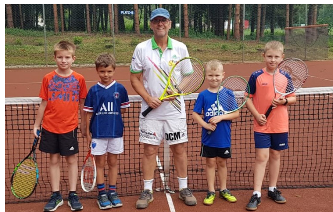
TC Neuberg Kinder-Tenniskurs