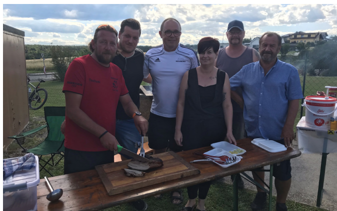
Kleinfeldturnier des AHC