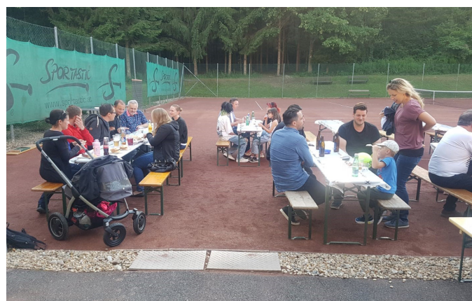
TC Neuberg Grillfest