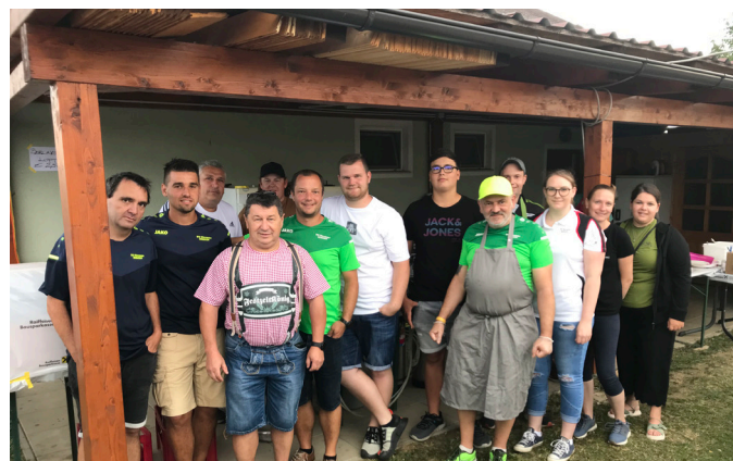
Straßenfest TC Bergen