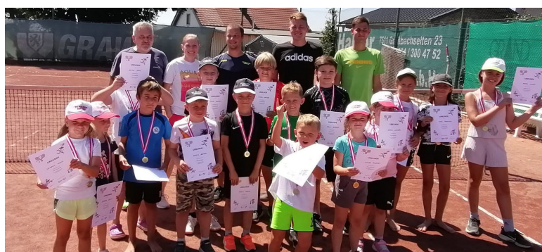
Tenniscamp TC Bergen